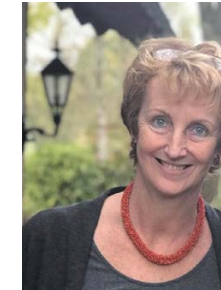
Pink van Veen Lid