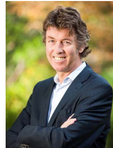
Cor Calis Lid